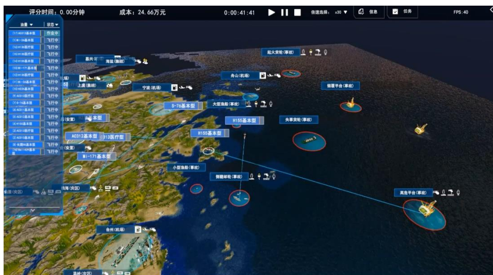
图 2 竞赛系统效果示意（推演仿真）